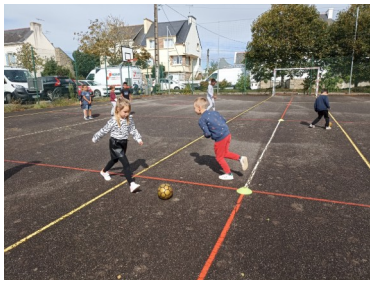
Ci-dessus atelier foot avec l'USC