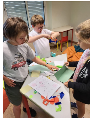
Atelier Origami mené par un enfant de CM2