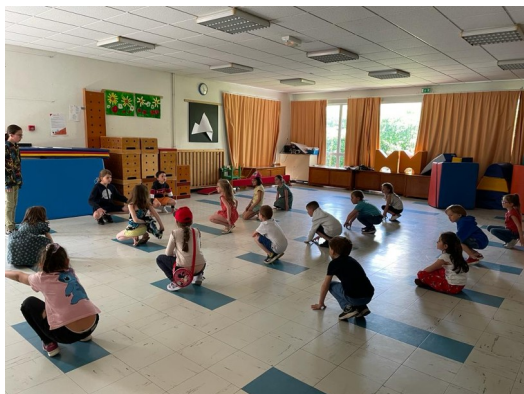
Atelier Hip Hop mené par des enfants de CM2

Un exemple d'action du C.M.E = les enfants ont la possibilité de partager une passion en proposant d'organiser et de mener des ateliers pour d'autres enfants (avec le soutien d'un animateur) sur le temps de la pause du midi ou l'accueil du soir.